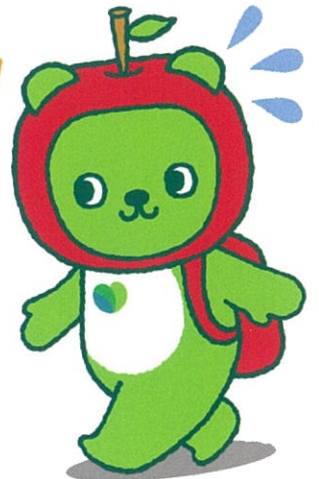
長野県PRキャラクター 「アルクマ」©長野県アルクマ